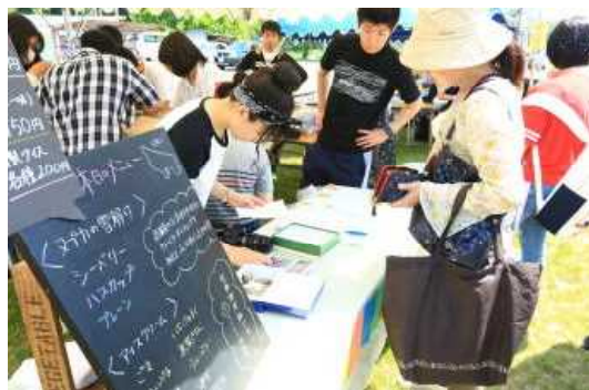
2日目の販売会の様子

一般公開では、どのブースも盛況となり、予定された一般販売を予定時間前に完売しました。両日も充実した学校祭となりました。